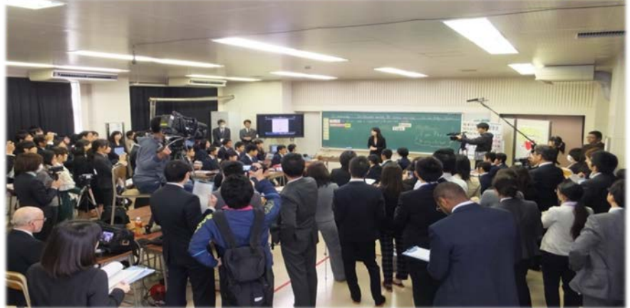
公開授業のシーン

4つの LOVE(気づき愛・ 支え愛・認め愛・高め愛) の溢れる集団に！ 誰一人残さず一体となり 挑戦し続けることができ る集団に！